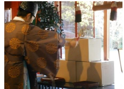
皆さまの合格を祈願して