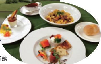
DIC川村記念美術館 パスタセット