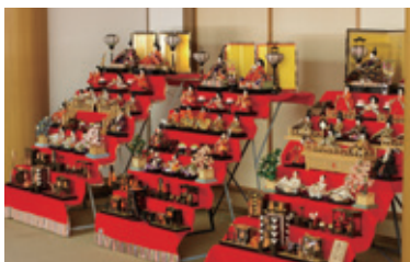
中山のおひなまつり