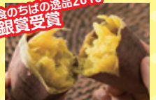
天然スイーツ 焼き芋 (70名様) 甘藷