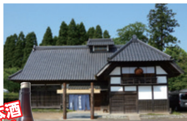
まがり家(飯沼本家)