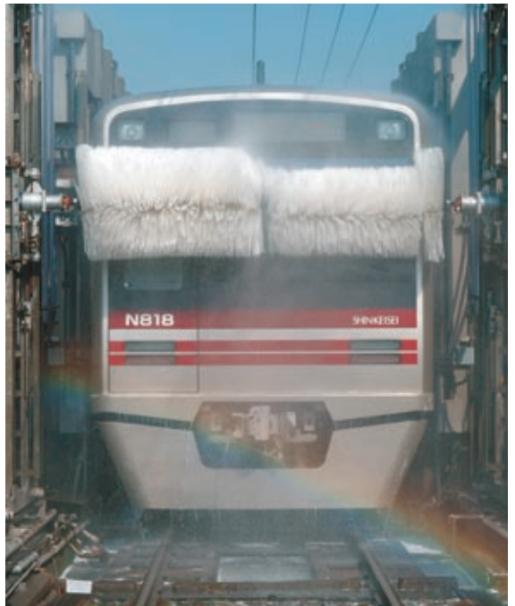
前面を洗っているところ。ブラシは上下に動く