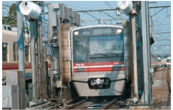
側面を洗い始めたところ。洗車機の大きさがよくわかる

座席のシートは、特にお客さまにふれるところから、少しでも汚れが見つかったらすぐに取り替えるようにしているよ。だから、靴を履いたままシートにあがったりしないでね。また近くで小さな子が上がりそうになったら「いけないよ」と注意してあげよう。