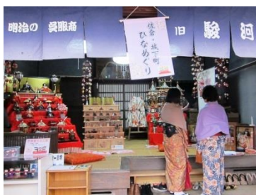
佐倉ひなめぐりときもの散歩

本ツアーは「沿線の観光スポットを巡る旅」の第6弾として発売するものです。ご好評のいちご狩りのコース等をはじめとして、成田山新勝寺での写経・精進料理体験とご朱印巡り（3か所）のコースや、佐倉城下町で着物を着てひなめぐり・散策をするコース等、早春の季節に相応しいプランを用意しています。また、今回は新たに千葉エリアにて京成グループ「笑がおの湯」（タオルセットレンタル付）と「ミラマーレ」で「ちばの旅」特別メニューを楽しんでいただくコースも設定しました。（ツアー内容については、次頁参照）