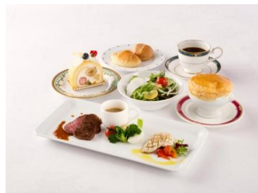
ミラマーレの食事（イメージ）