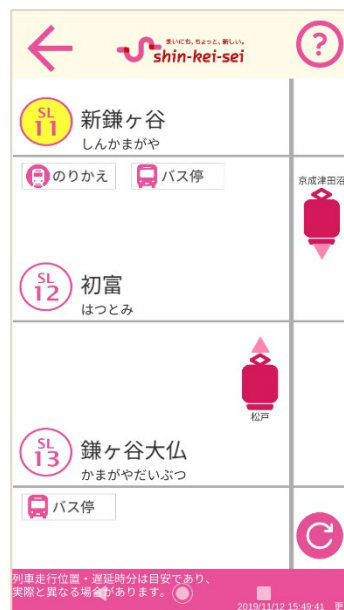
列車走行位置画面