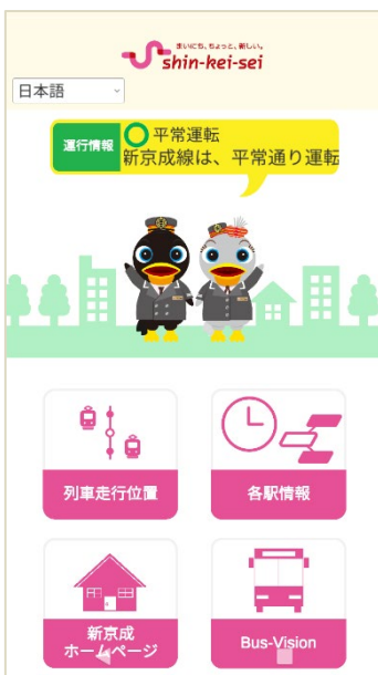
トップ画面（日本語）