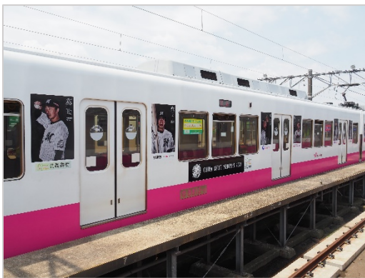
車両側面に千葉ロッテマリーンズの選手がデザインされたマリーンズ号(左)

今回新型コロナウイルス影響の中、お客さまにはご自宅からでもマリーンズ号を楽しんでいただきたいとの思いから、2020年マリーンズ号の車内やラッピング作業の様子を撮影し、新京成電鉄YouTube公式チャンネルや公式Twitterにて近日中に公開する予定です。