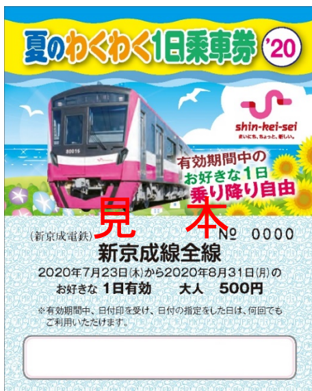
夏のわくわく1日乗車券（表面）

「夏のわくわく1日乗車券」は新京成の各駅（京成津田沼駅を除く）にて枚数限定で発売します。今年の夏は企画乗車券を片手に、ご家族や友人と新京成沿線で楽しい思い出を作ってください。