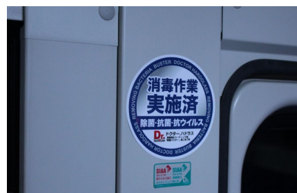
このステッカーが施工済みの目印