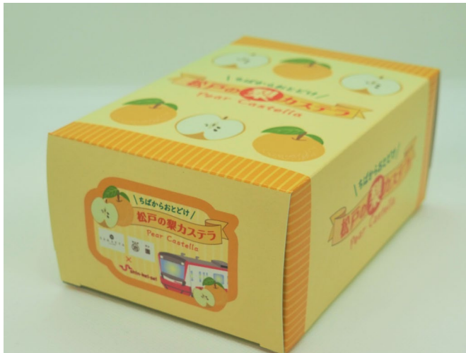
松戸の梨カステラ