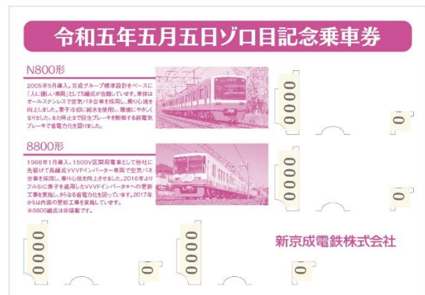
台紙裏面 表面で登場したN800形と8800形の紹介を掲載しています