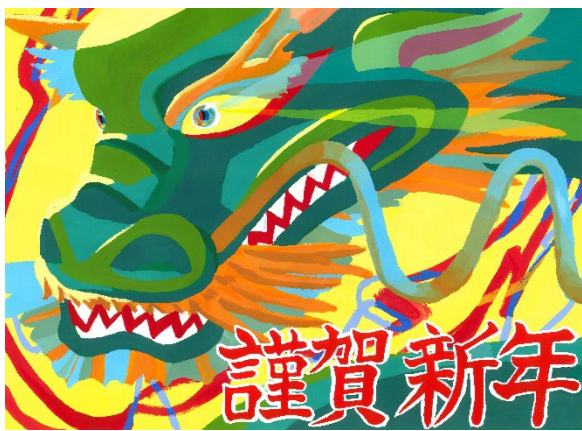
本間さんの作品 (松戸方先頭車両に掲出するヘッドマーク)

※この企画につきましては、2019年新春から沿線の高校生にデザインをお願いしております。今年度は沿線の鎌ヶ谷市にある千葉県立鎌ヶ谷高等学校に生徒の紹介をお願いしました。