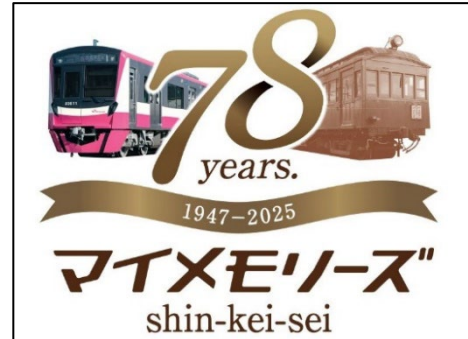
18パターンあるアイコン

「マイメモリーズトレイン」の運行情報は前日17時より以下のサイトで公開しています。ぜひご乗車いただき、新京成の歴史からあの時乗った電車、あの時の風景、ご覧になった方の思い出も一緒に振り返ってみてはいかがでしょうか。