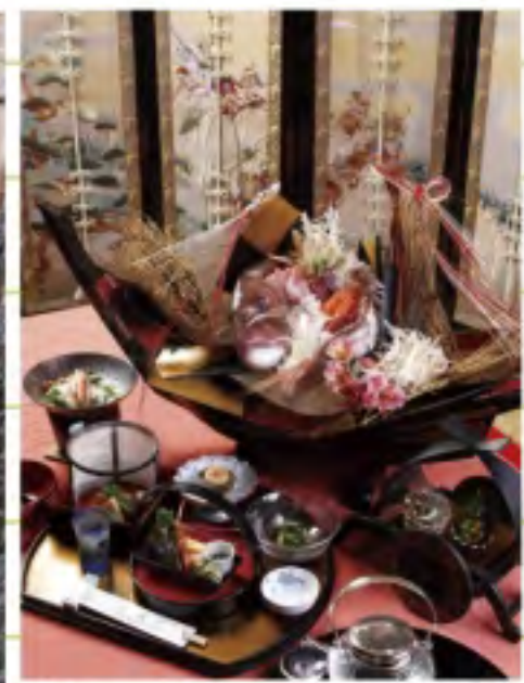
⑤旬の食材や鯛、サザエなどの海産物など、美しい料理が自慢です。