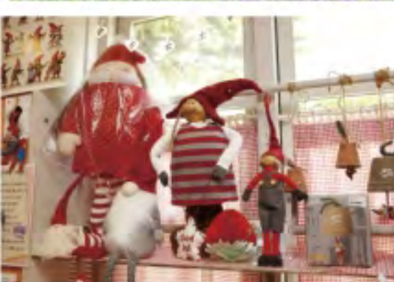
グッズショップにはデンマーク製の可愛い商品が並びます。