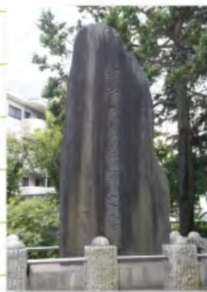
郷土資料館敷地にある「明治天皇駐蹕之処の碑」