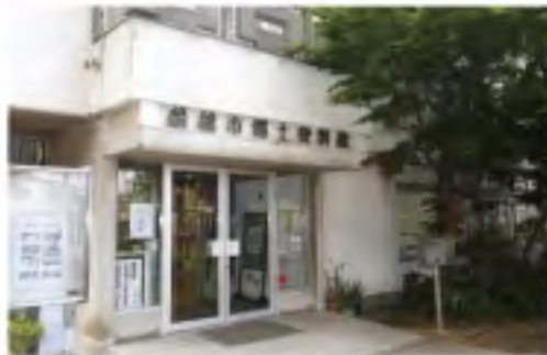
昭和47年開館。 市指定有形文化財の「瑞花双鳳五花鏡(ずいかそうほうごかきょう)・梅花文鏡筒(ばいかもんかがみばこ)(残欠)」

〒船橋市薬円台4-25-19 開館時間 9:00～17:00(入館は16:30まで) 休館日 月曜、祝日の翌日(土・日は除く)、※5月3日～5日は開館 観覧料 無料 所在地 新京成線習志野駅から徒歩10分。JR津田沼駅北口から船橋新京成バス「北習志野駅」「高津団地中央」「習志野車庫」「八千代緑が丘駅」行きで「郷土資料館」下車徒歩2分 電話 047-465-9680