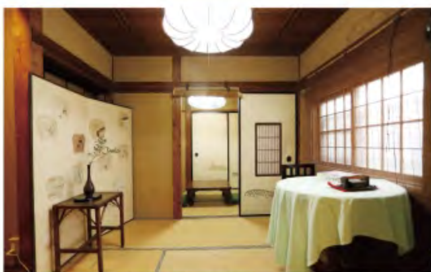
④太宰治が投宿した「桔梗の間」

〒船橋市湊町2-6-25 ①泊2食付き14,500円～ ②JR・東武・京成本線船橋駅から徒歩8分 ③047-431-3234