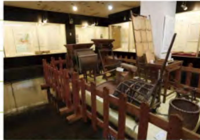
2階の常設展示室。農具や漁具も公開されています。