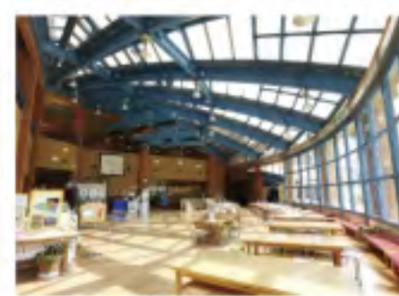
子ども美術館ゾーン、制作体験ができるワークショップ室。雨の日でも楽しめます。