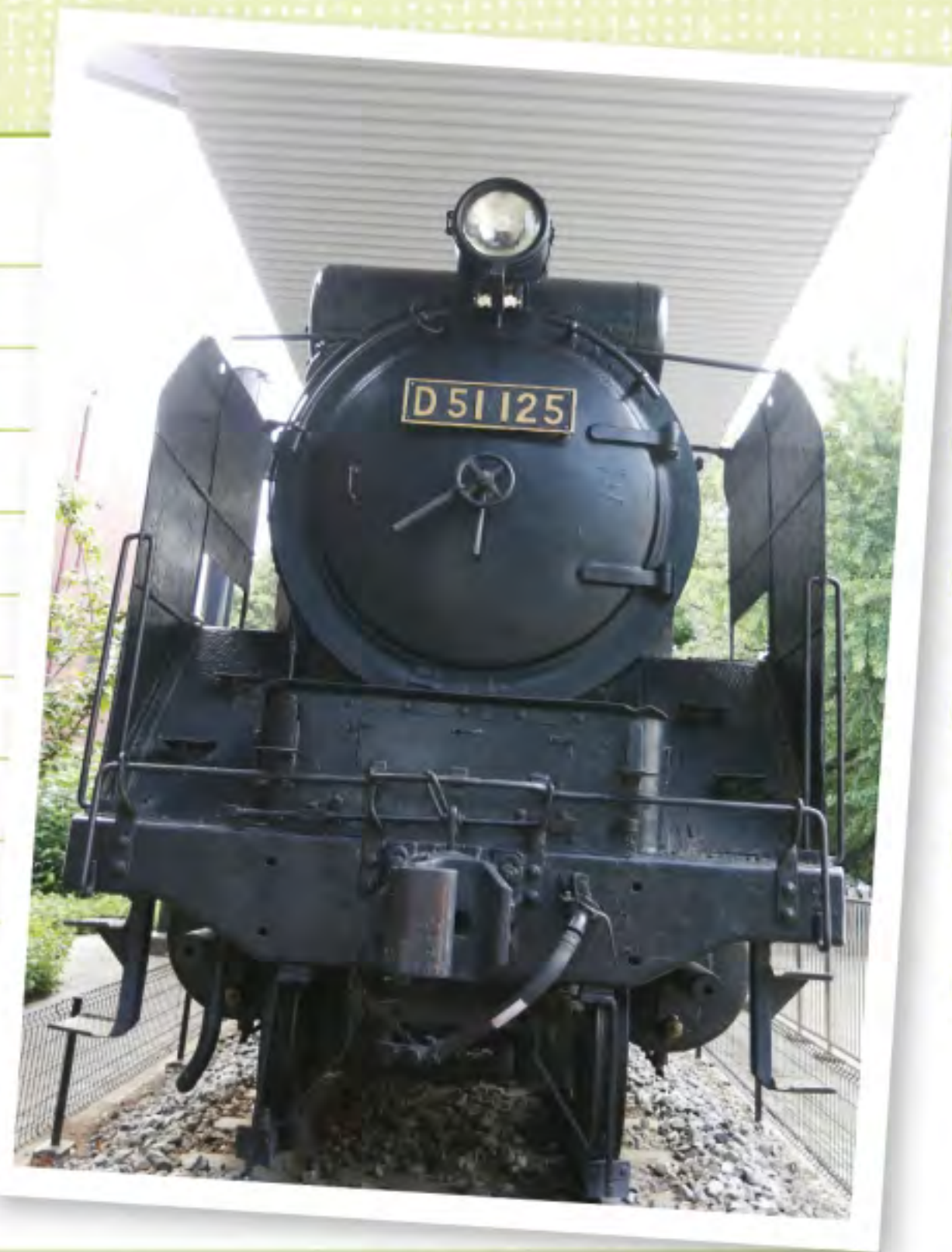
野外展示のD51型蒸気機関車。資料館1階ロビーに、資料を展示。