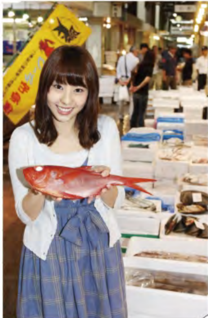
◎金目鯛!ピチピチしています。