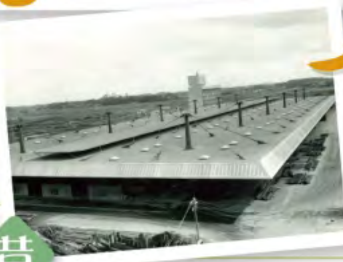
◎昭和43年頃の建設中の市場。