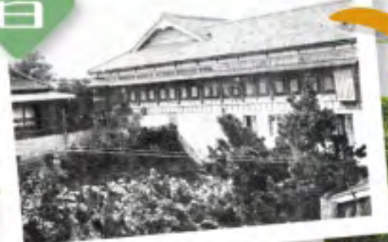
⑦昭和3年から別館が造られました。 ⑧一番古い大正時代の建物も健在です。