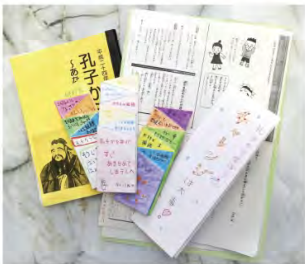
一年間の集大成として、論語ノートやカラフルなリーフレットを作りました。