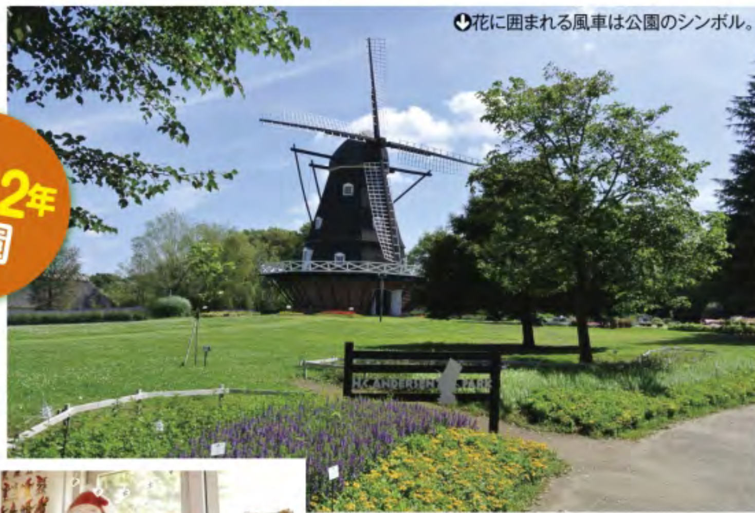
花に囲まれる風車は公園のシンボル。

休 月曜(祝日、GW、春・夏休みは開園) 入 一般900円、高校生600円、小・中学生200円、4歳以上100円 交 新京成線三咲駅から船橋新京成バスコマメディック病院行き・北習志野駅から小室駅行き「アンデルセン公園」下車徒歩1分 ほか ☎047-457-6627