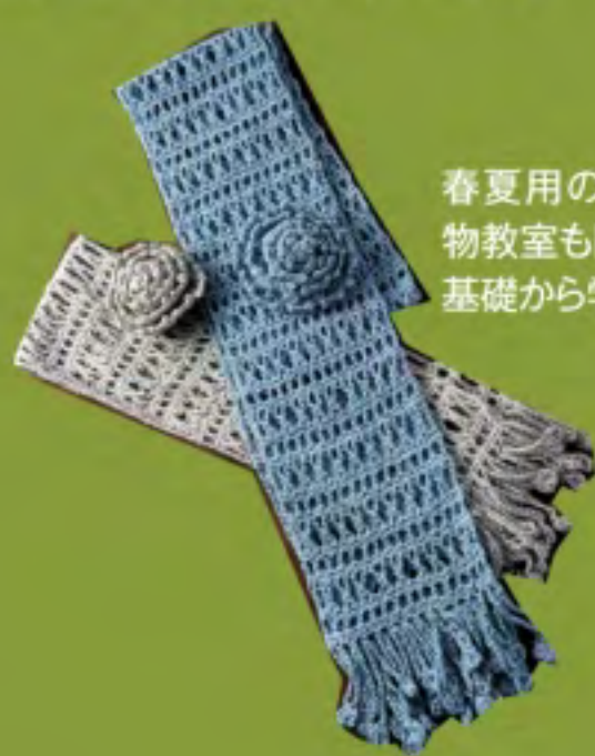
春夏用のストール。編物教室も開講しており、基礎から学べる。

わっていると話されるとおり、決して奇抜なデザインのものはありません。洋裁というとスカートやワンピースといった実用品を作るものばかり思っていました。作りましたが、個性がよく表れた作品なので、自分らしさを表現する身近なアート、洋裁に挑戦してみませんか。