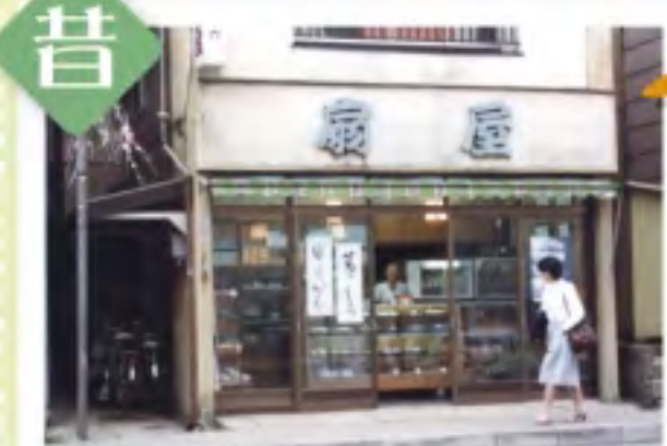
昭和41年創業当時の店舗。