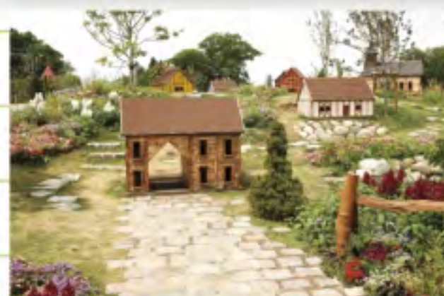
今春、花の城 ゾーンにオー プンしたミニ チュアガーデン 「オーデンセ の町」

私のお気に入り はメルヘンの丘 ゾーン。風車 や噴水、石畳、 ガス灯など異 国情緒が溢れ ています。夏は ヒマワリの迷 路もおすすめ です