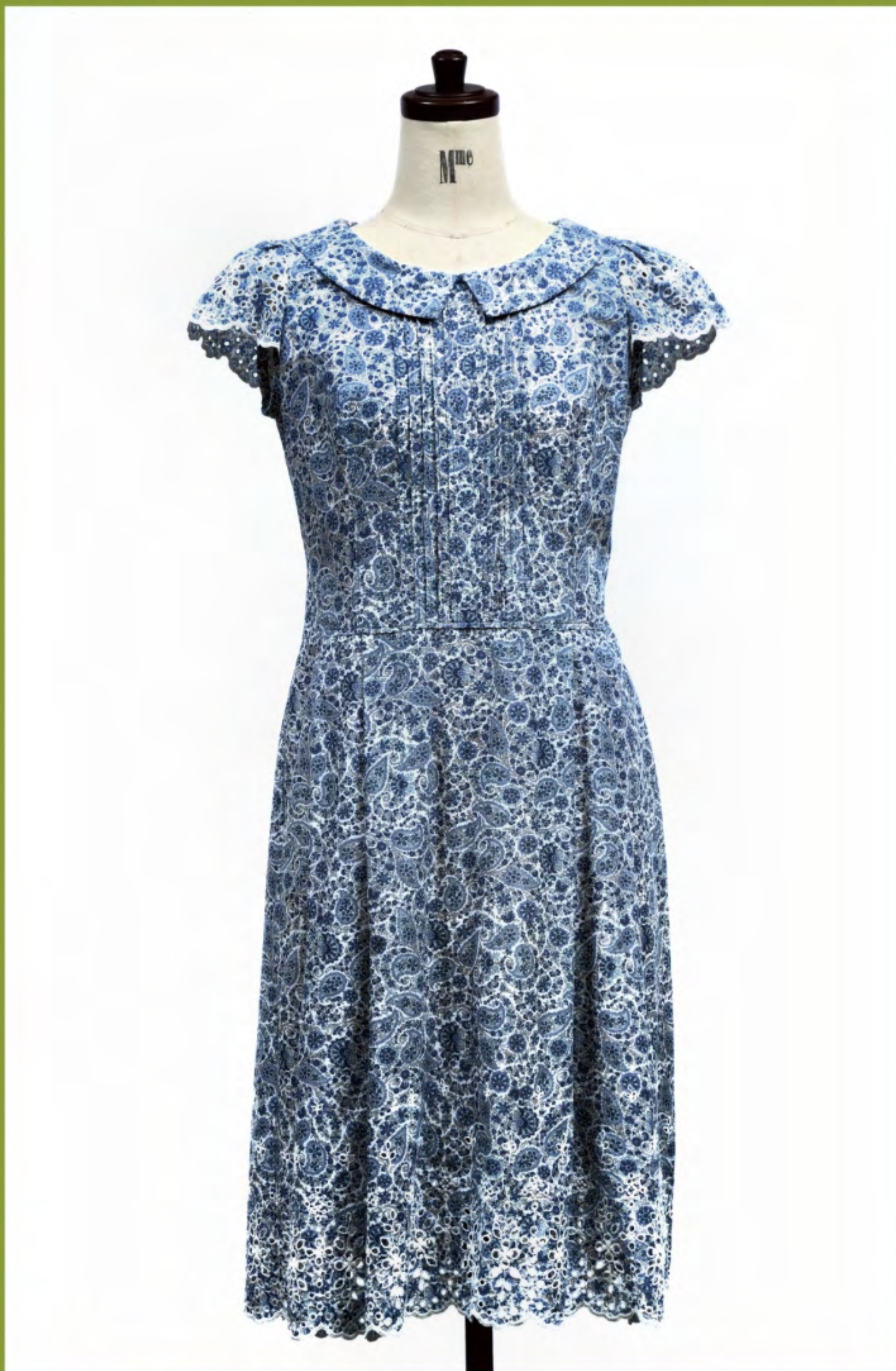
ボーダーレースの生地を使った、女性らしいシルエットのワンピース。