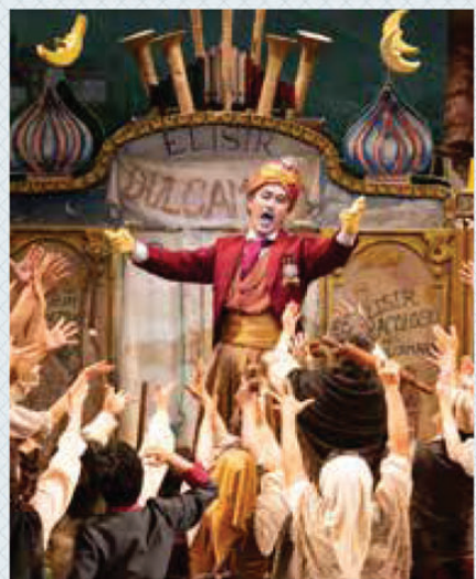
藤原歌劇団・NISSAY OPERA 2019公演「愛の妙薬」 ドゥルカマーラ役

これまで出演したオペラで、幅広い役柄を演じてきた三浦さん。どんな役を演じるときにも心掛けているのが「余計なことをしないこと」と話します。 「人が笑うような面白いオペラの役をやるとき