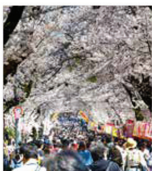
常盤平さくら通り

松戸市には通りの名前に「さくら」がつく道が多くあり、桜スポットも多数ある「さくら」のまちです。