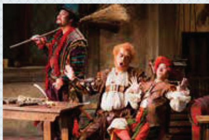
ヴェルディ作曲オペラ『ファルスタッフ』 ファルスタッフ役(中央)