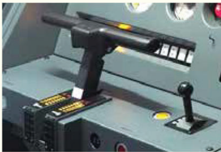
80000形のマスターコントローラー

A 4つの形式の電車が走っているけれど、運転の仕方は基本的にはすべて一緒だよ。分かりやすく自動車と比べると、自動車では足を踏んでアクセルやブレーキのペダルを操作して、加速や減速をしているけど、電車では「マスターコントローラー」という手元のレバーを操作して運転するんだ。自動車ではペダルを踏む力を調節して加速や減速の具合を調節するけど、電車のマスターコントローラーにはステップが刻んであって、その操作によって加速・減速する力が段階的に変わるんだ。