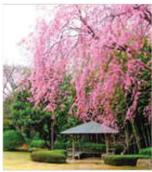
戸定邸の紅だれ桜

『日本の歴史公園100選』と『関東の富士見百景』に選ばれている戸定が丘歴史公園も、桜の時期には、ベニシダレザクラを見るために連日大勢の人が訪れます。