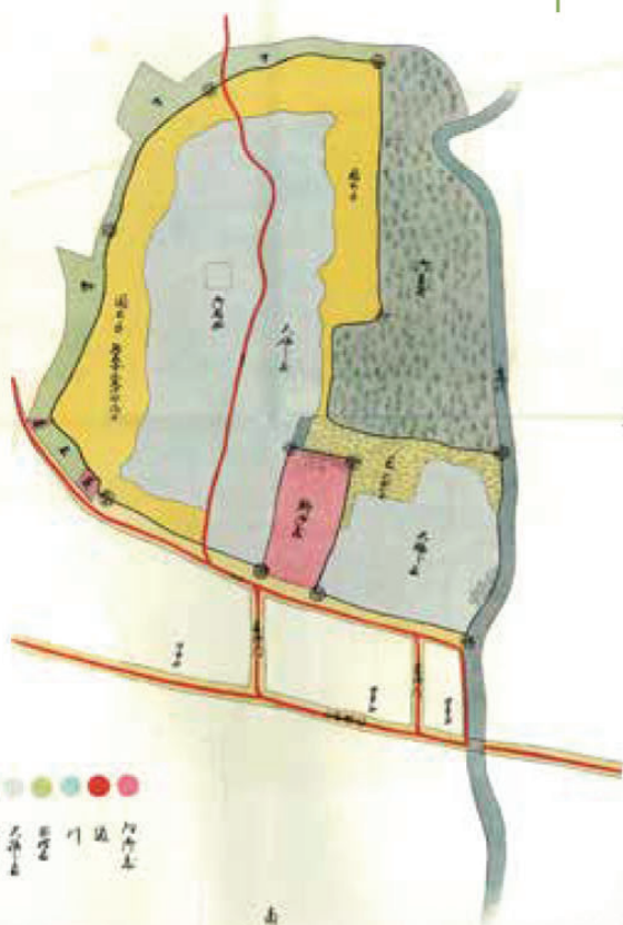
宝永四年四月船橋御殿地絵図

1614年前後には2度にわたって上総東金で狩りを催しており、その頃に現在の船橋市本町4丁目周辺に造られたのが「船橋御殿」でした。御殿の敷地は海老川の西側の土手まで広がっており、その面積は3〜4ha