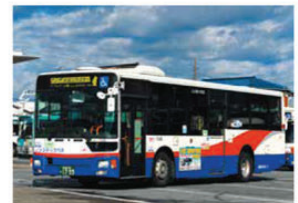
アンデルセンライナー

3月19日のダイヤ改正に伴い、船橋駅北口とアンデルセン公園を結ぶ「アンデルセンライナー」、古和釜十字路から船橋駅北口方面の「高根ライナー」が登場しました。詳細は新京成オフィシャルサイトをご覧ください。