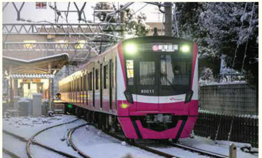
ゆきの中を走行する80000形