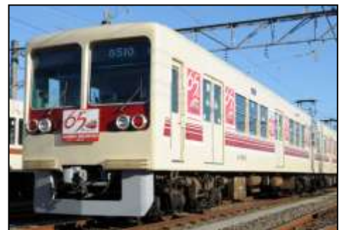
3月19日に運行を終了した「今昔ギャラリーートレイン」