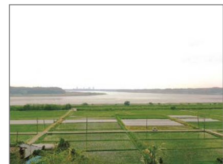
徳性院から見た印旛沼

ご参加いただき完歩された方には、先着4,000名様に「4社合同ウォークオリジナルバッジ」をプレゼントします。事前申し込みは不要、参加人数にも制限はございませんので、お気軽にご参加いただけます。残暑も終わり、秋風が薫る初秋のウォーキングをぜひお楽しみください。皆さまのご参加をお待ちしています。