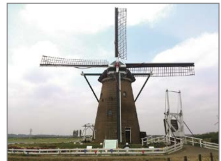
佐倉ふるさと広場

本イベントは、ウォーキングを楽しみながら、沿線の見どころや地域の魅力を再発見していただくことを目的として開催し、今回で通算10回目になります。千葉県東葛地域を走る鉄道4社の合同イベントのため、日頃ご利用いただいている鉄道路線以外の新たな街へ一足伸ばせる機会として大変好評をいただいております。